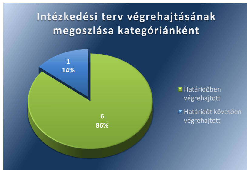
1. számú ábra