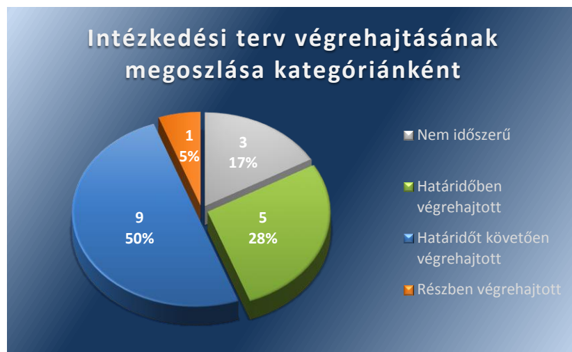
1. számú ábra