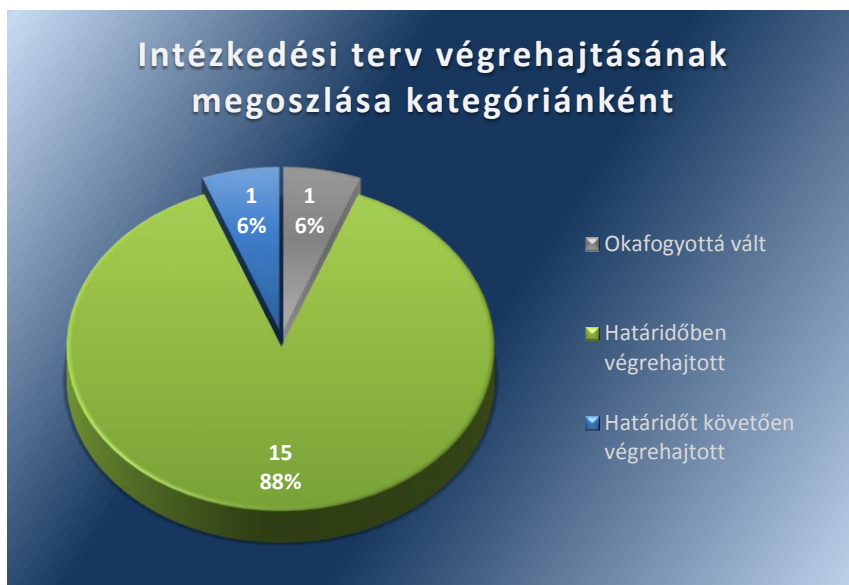
1. számú ábra