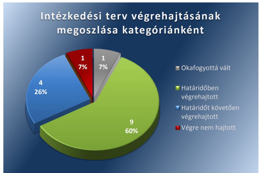
1. számú ábra