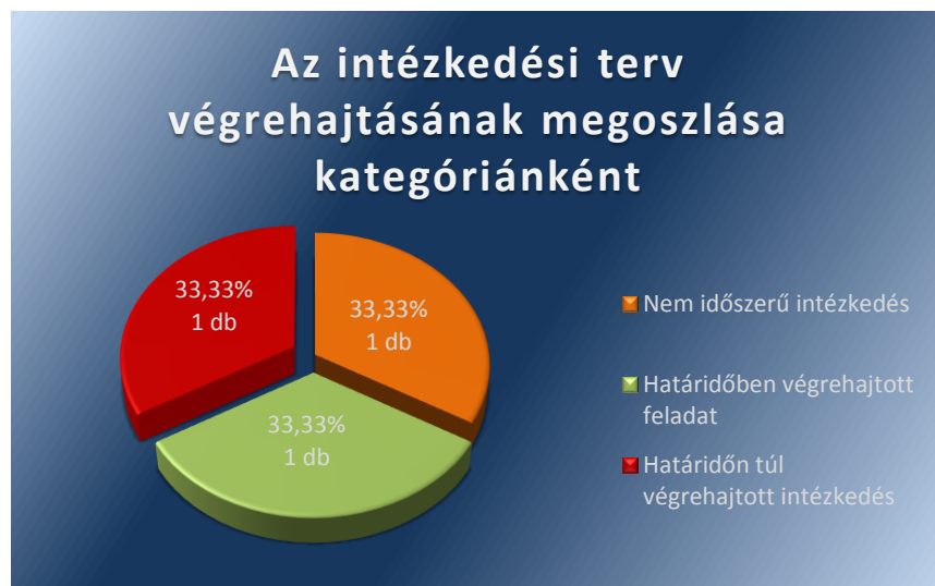
1. számú ábra

Az ÁSZ jelentés két javaslatára az MNV ZRT. az intézkedési tervében három intézkedési feladatot határozott meg. Egy intézkedést határidőben, egy intézkedést határidőn túl hajtottak végre, egy intézkedés nem volt időszerű 17 az utóellenőrzés időpontjában. Az intézkedési tervben felelősként a gazdasági főigazgatót, az ingó- és ingatlanvagyonért felelős főigazgatót, illetve az ellenőrzési igazgatót nevezték meg. A feladatok kategóriánkénti megoszlását az 1. számú ábra mutatja be.