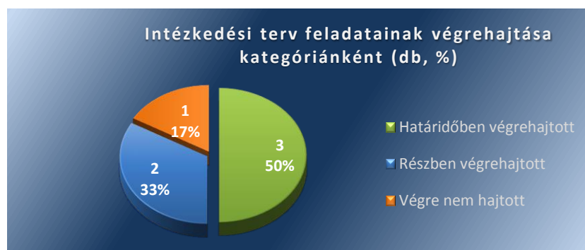
1. számú ábra

A Képviselő-testület által jóváhagyott Intézkedési terv 1 -ben a polgármester részére előírt egy intézkedési feladat részben végrehajtott, a jegyző felelősségi körébe tartozó Intézkedési terv 2 -ben meghatározott öt feladatból az ellenőrzött dokumentumok alapján két feladat végrehajtása az Intézkedési terv 2 -ben előírt tartalommal és határidőben végrehajtott, egy feladat részben végrehajtott, egy feladat végre nem hajtott volt. Az Intézkedési terv 1,2 feladatainak 50%-a határidőben végrehajtott, 33%-a részben végrehajtott, míg 17%-a végre nem hajtott feladat volt. Az Intézkedési terv 1,2 feladatai végrehajtásának megoszlását kategóriánként az 1. számú ábra szemlélteti.