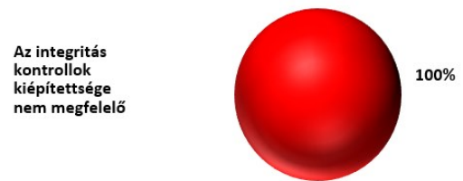
2. ábra: A jogszabály által előírt, alapvető integritás kontrollok kiépítettsége az ellenőrzött közös önkormányzati hivatalok arányában

Az ellenőrzés megállapította, hogy a 168 önkormányzat 46%-ánál és az általuk működtetett 24 önkormányzati közös hivatalnál a szervezeti integritás és az elszámoltathatóság alapvető követelményei és feltételei nem teljesültek,