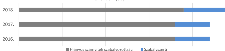
24* intézményfenntartó közpénzfelhasználásának értékelése a 2016-2018. években (db)

18 fenntartó a 2016-2017. években, 19 fenntartó a 2018. évben az Alaptörvény 1 39. cikk (2) bekezdésében foglaltak ellenére a felhasznált közpénzekre vonatkozó gazdálkodása átláthatóságát nem biztosította. Ezen fenntartók esetében felmerül annak a kockázata, hogy a jövőben a kapott támogatásokat nem szabályszerűen használják fel, és a közpénzeket nem átláthatóan kezelik. A 2016-2017. években négy, a 2018. évben öt fenntartó ellenőrzése során alapvető hibát nem tárt fel az ÁSZ 2 a gazdálkodásuk átláthatósága és elszámoltathatósága terén.