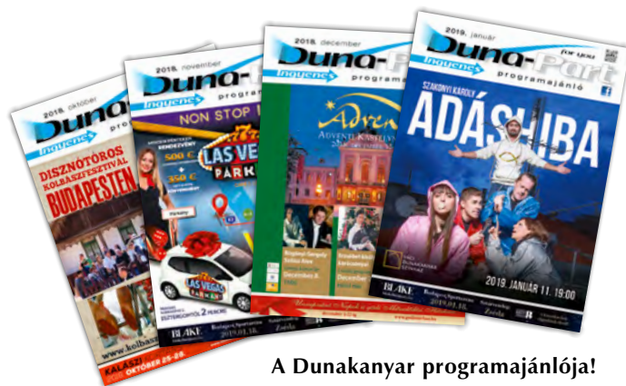
A Dunakanyar programajánlója!

Címlap lénia vágott mérete: 148x13 mm, a kifutás kétoldalt és alul: 3 mm (kifutó méret 154x16 mm)