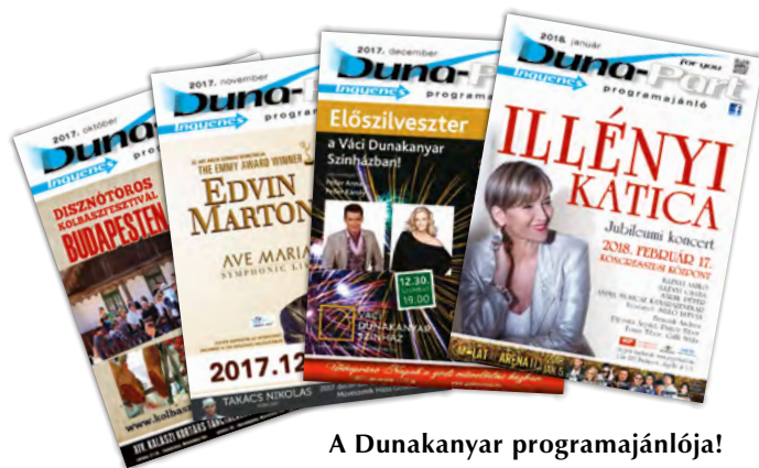
A Dunakanyar programajánlója!

Vágott méret: 148 mm x 199 mm Kifutó méret: 154 mm x 205 mm. A kifutás minden irányban: 3-3 mm Lénia vágott mérete: 116x20 mm, a kifutás csak felül: 3 mm. Címlap hirdetés vágott mérete: 148x145 mm, a kifutás kétoldalt: 3-3 mm (kifutó méret 154x145 mm). Címlap Lénia vágott mérete: 148x13 mm, a kifutás kétoldalt és alul: 3 mm (kifutó méret 154x16 mm)