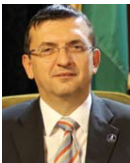
Domokos László az Állami Számvevőszék elnöke

A tanulmány-sorozatunk az elmúlt öt év egyik legfontosabb tudásterméke. Célunk mintaadó szervezetként a „jó gyakorlatok” hazai és nemzetközi megosztásának, ezáltal a „jó kormányzás” támogatás mellett az államról és a közéletéről alkotott szemlélet formálása, a közgondolkodás fejlesztése.